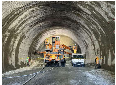
トンネル内施工状況