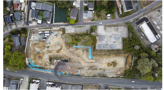
大井非常口ヤード全景（写真）