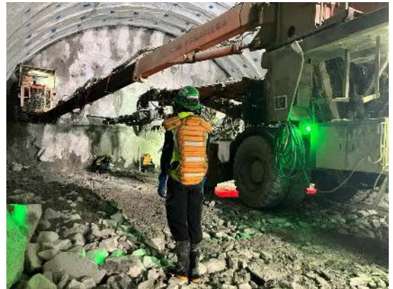
トンネル掘削作業状況 （装薬状況）