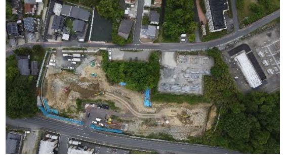
大井非常口ヤード全景（写真）

※6月中～下旬より市道01171号線道路付替え工事を開始する予定です。（工事開始時期は、関係者との協議進捗等により変更となる場合があります。）