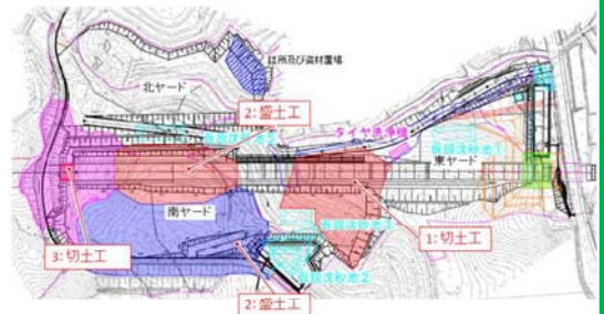
ヤード整備工平面図