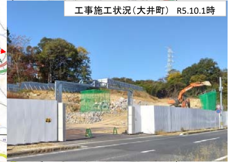
工事施工状況(大井町) R5.10.1時