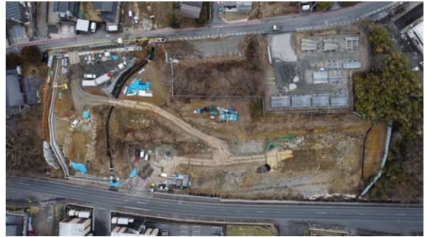
大井非常口ヤード全景

今回の期間における水路の付替え工事による掘削土は発生していないため、三郷町へダンプ運搬は行っておりません。