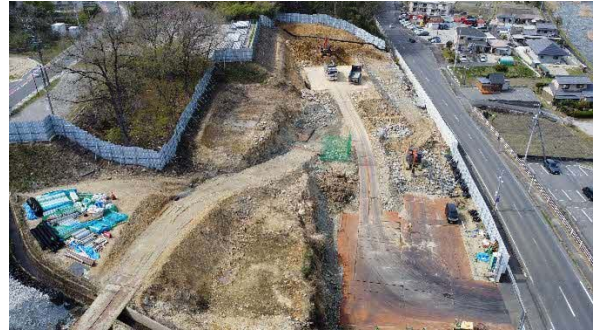
大井非常口ヤード全景

また、場外では3月下旬から4月上旬にかけて早層洞新田線の道路上に張り出した樹木の伐採を行いました。