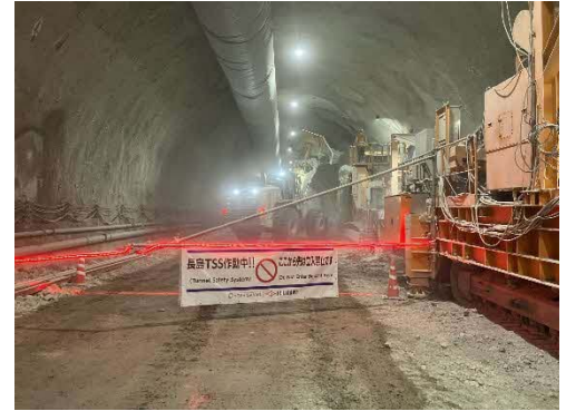
トンネル掘削作業状況

ヤード周辺の井戸・河川における11月の水質調査は全て基準値以内でした。12月の調査結果につきましては、次号にてご報告いたします。