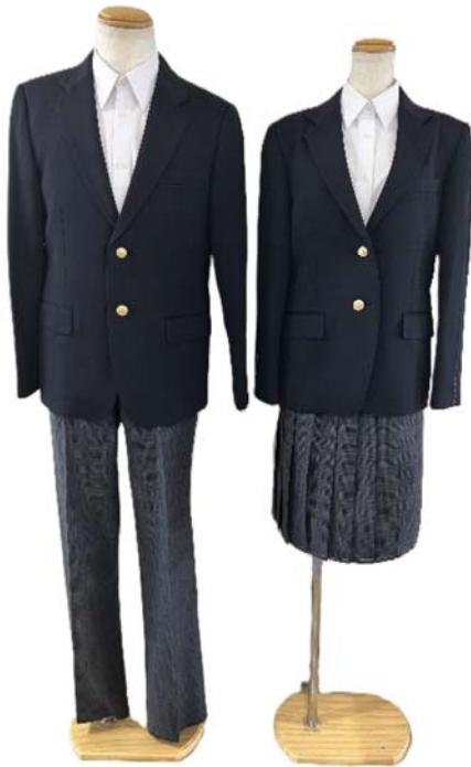
(ブレザー・ボトムス)