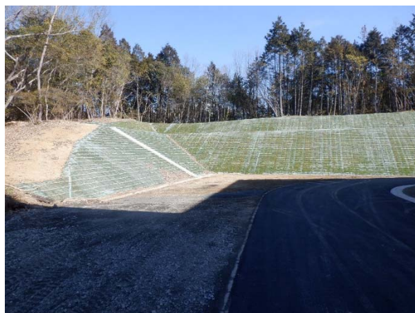
防災工事施工事例 (令和4年度大井第二小学校)