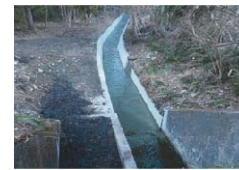
用水路の漏水対策整備