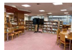
山岡コミセンまなびルーム