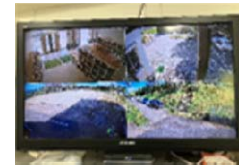
防犯カメラ稼働状況 (三郷小)