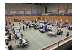
中津川・恵那おしごとフェア