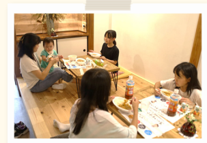
▲こども食堂の様子