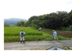
集落協定の草刈り作業