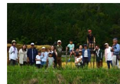
稲刈り・はぎ掛けの体験会

地域の担い手不足解消の一助とするため、継続的に地域や地域の人々に関わる関係人口を拡大し、持続可能な地域づくりを推進する。