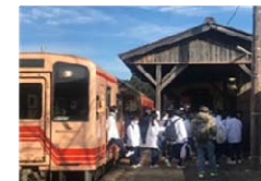
明知鉄道を利用する学生