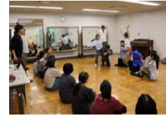
演技ワークショップの様子