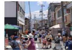
まちなが市で賑わう商店街