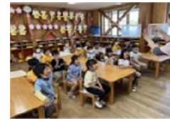
すずめっこ杉の子幼稚園の様子