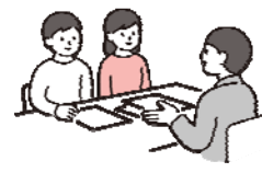
相談対応のイメージ