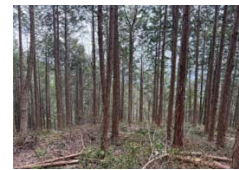
間伐を実施した私有林