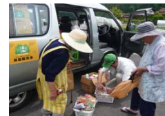
移動販売車を利用する様子