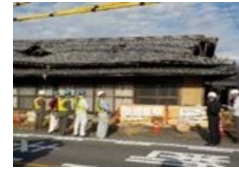
危険性が高い空き家

市民の安心・安全な住環境を確保するため、倒壊の危険性がある空き家の解体に係る経費を補助する。