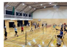
クラブ活動の様子