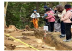
令和7年度発掘調査現地説明会