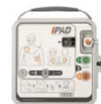
設置するAEDのイメージ

AEDを24時間使用できるようにするため、24時間営業のコンビニエンスストアにAEDを設置する。