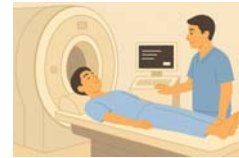
医療機器のイメージ