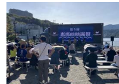
補助金を活用したイベント