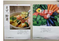
野菜ファースト事業啓発

生活習慣病の発症予防・重症化予防による健康寿命の延伸を目指し、食生活改善の啓発に取り組む。