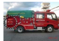
更新車両イメージ