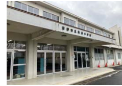
現在の長島小学校