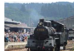
明智駅構内を走る蒸気機関車