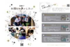
助成制度のパンフレット