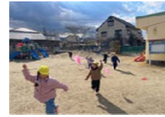
千草保育園の様子