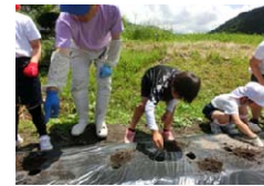
地域学校協働活動の様子