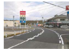
舗装修繕後の状況