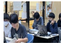
高校生プログラミング講座