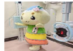
検診を受けるエーナ

がんの早期発見・早期治療でがん死亡を低減させるため、各種がん検診を実施し、未受診者や要精密検査未受診者には受診勧奨を行う。