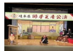
令和7年度岐阜県獅子芝居公演