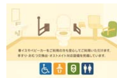
多目的トイレのイメージ