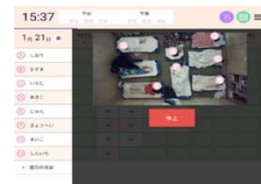
システム画面（イメージ）