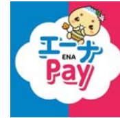
電子商品券アプリ