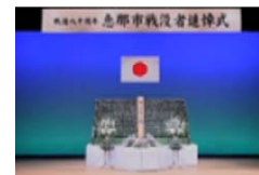
恵那市戦没者追悼式