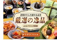
返礼品特集バナー