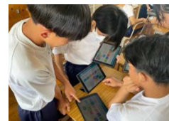
タブレットを活用した学習

ICT教育ツールを活用し、個別最適化された学習を支援することにより、学力の向上を図る。