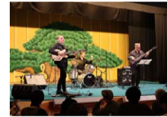
ポーランドジャズ公演in五毛座