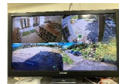
防犯カメラ稼働状況 (三郷小)