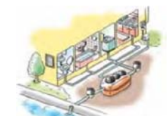
浄化槽設置イメージ