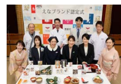
えなブランド認定式