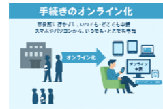
オンライン化イメージ