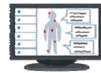
電子カルテシステムのイメージ

市民のかかりつけ医として、医療を身近で安全なものにするため、医療DXに取り組む。