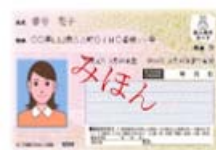
マイナンバーカードみほん