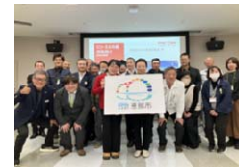
推進協議会（交流会）の様子