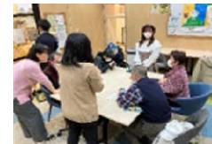
スマホ教室の様子