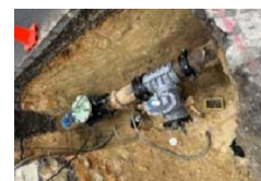
配水管の耐震化イメージ

災害時でも基幹病院や避難所等へ水道水を安定的に供給するため、配水管の耐震化を行う。