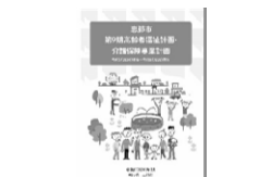
高齢者福祉計画・介護保険事業計画