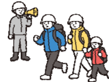
防災訓練のイメージ

地域全体で学校の安全を守る体制を構築するため、教職員の研修支援や安全教育の充実、地域連携強化などを通じて、学校安全の質向上を図る。