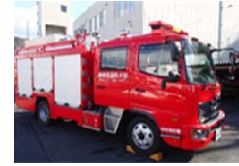
更新する車両のイメージ

消防力の強化を図り、住民の安心・安全を維持するため、導入から21年が経過し経年劣化した消防車両を更新するとともに、圧縮空気泡消火装置、ホースカーなどの消防装備を拡充する。