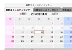
システム予約画面