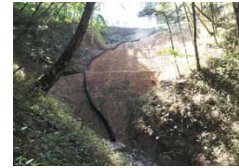
暗井沢線改良工事

林道の改良、舗装等を効率的・効果的に実施し、山村地域の振興、森林整備の推進、林業施業の作業効率の向上を図る。