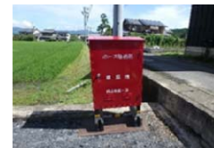
放水器具収納箱設置イメージ

地域防災力の強化を図るため、消火栓を設置する。また、消火栓付近に放水器具収納箱を設置し、初期消火訓練等を通じた住民間の連携強化と防災意識の向上を図る。