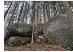
クレジットを創出する森林