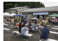
地域自治区の活動の様子