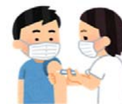
予防接種のイメージ