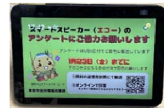
スマートスピーカー