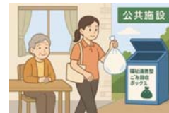
福祉と環境をつなぐ仕組み