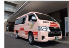
まちなか巡回バス