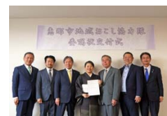
委嘱を受ける地域おこし協力隊

市内6地域（笠置、中野方、岩村、明智、串原、上矢作）に配属した隊員とともにまちづくりを進め、希望する地域へ隊員を設置する。外部人材を活用することで、新たな視点で地域資源の魅力を活かしたまちづくりを進める。