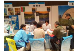
移住フェアでの恵那市のPR