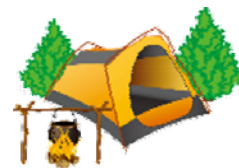
アウトドアコンテンツイメージ

観光地としての魅力や質を向上し価値を高めることを目的に、市内の観光地の磨き上げや受入環境整備を行う市内事業者等に対し、事業費の一部を補助する。