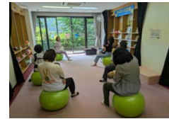
産後サロンの様子