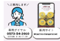
交通コンシェルジュ