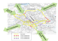
リニアまちづくり基盤整備計画

リニア中央新幹線の開業を見据え、市街地環状道路など都市の基盤となる道路整備を進める。恵那峡スマートICからの観光地アクセス向上や沿道地域活性化のため、原前田線・奥戸前田線の都市計画決定に向けた取り組みを行う。