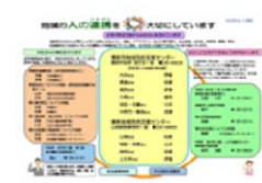
包括支援センターパンフレット