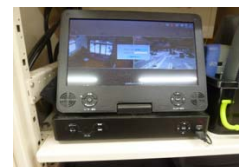
設置状況（おさしま二葉こども園）