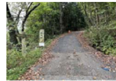
中山道十三峠入口(長島町)