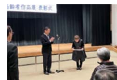
高齢者作品展表彰式