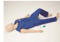
救急訓練人形のイメージ

様々な処置に対応するため、経年劣化した救急訓練人形を更新し、訓練による活動能力向上を図ることで、救命率向上を目指す。