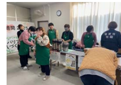
障がい者週間の様子