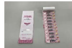
公共交通利用券（令和7年度）