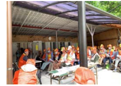
捕獲従事者講習会