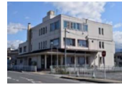
現在の恵那市福祉センター