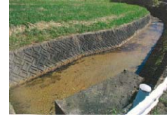
浸漬後の河川状況

近年の豪雨災害の頻発化による河川等の氾濫を防ぐため、普通河川の改修や、堆積土砂の撤去により洪水時の被害軽減を図る。