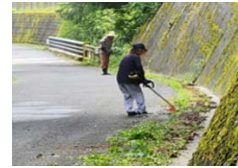
市民による市道の草刈り