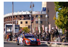
ラリージャパン2025の様子