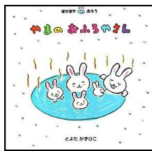
『やまのおふろやさん』 作・絵 とよたかずひこ ひさかたチャイルド