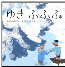
『ゆきふふふ』 作 ひがしなおこ 絵 きうちたつろう くもん出版

実体験とあわせて、冬を感じる絵本もおすすめです。恵那市中央図書館やコミュニティセンターの図書室で借りられて、小さい子も楽しめそうな絵本をご紹介します。