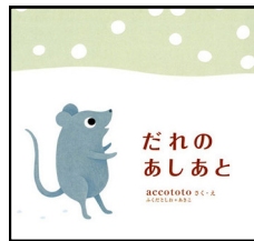
『だれのあしあと』 作・絵 accototo 大日本図書