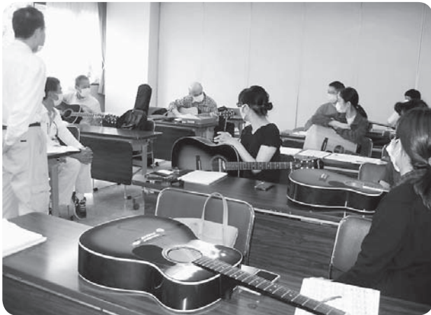
アコースティックエレキギター講座