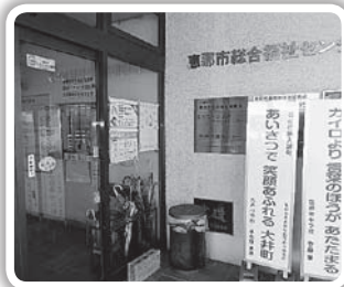
大井児童センター

公の施設をノウハウのある民間事業者等に管理してもらう制度。恵那市は平成18年から導入。今回継続の更新時期となり、市民の皆さまの評価をもとに審議を行い、継続の更新となりました。