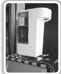
アルコール消毒器