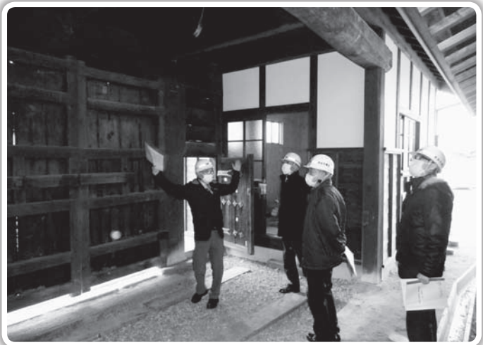
恵那市中山道明治天皇大井行在所

中山道明治天皇大井行在所を公の施設として管理するため、この条例を定めるものです。歴史的な価値を有する中山道明治天皇大井行在所を保存し、及び公開して、市民の利用に供するとともに、市民の歴史文化等に関する活動及び交流の場を提供し、もって市民の教養、学術及び文化の発展に寄与するため、中山道明治天皇大井行在所を設置します。行在所には長屋門・展示スペース・交流スペースを置き、目的を達成するための事業を行うとし、行在所の管理は、教育委員会が行うものである。ただし、地方自治法第244条の2第3項の規定により、法人その他の団体であって別に定めるところにより、教育委員会が指定したものが行うことができるものとしている。令和元年3月議会の審議で、議会より、管理する団体の体制の充実、自主財源の確保が長年にわたる施設管理運営を行う上で、指定管理者の選定は重要な案件であるとし、予算執行に付帯決議をしており、その趣旨を踏まえ指定管理者選定は慎重に検討することを望む。