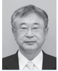
まちの michi あき 町 野 道 明