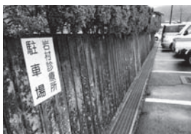
観光客への注意看板（岩村診療所）

答 地域自治区が、地域課題の解決や地域の特性をいかしたまちづくりを推し進めるために、地域振興基金や人口減少対策基金ふるさとえな応援寄附金を活用した支援を行い、ハード整備を含めた地域の自治力を高めていきたい。各地域が勢力的に取り組まれている事項に対して、より効果的かつ柔軟な支援ができるよう努め、「担い手」としてより主体的なまちづくり活動を盛り上げていきたい。（まちづくり企画部長）