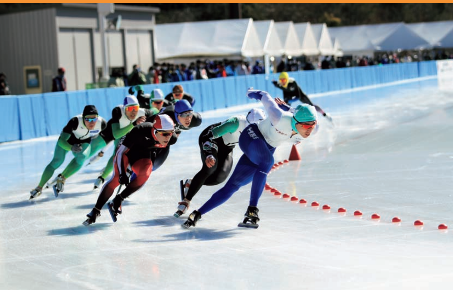
第76回国民体育大会冬季大会スケート競技会（スピード）「岐阜県クリスタルパーク恵那スケート場」