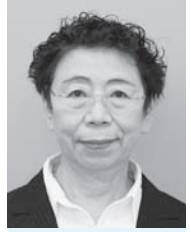
さ わ たり み な え