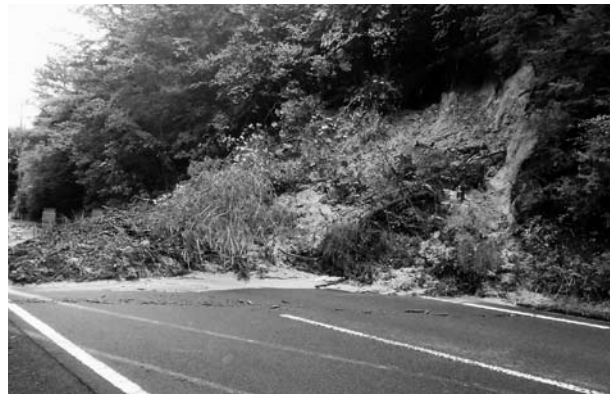
7月豪雨の被害状況