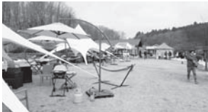
グランピング体験の様子(イワクラ公園)

市内には優れたロケーションが多く、キャンプ場も市内各地に多数あるため、アフターコロナ期の新たなアウトドアスポットとしてのグランピングや車中泊について、引き続き取り組みでいきたいと思います。 (商工観光部長)