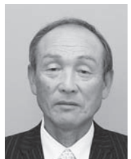
ご と う や す し