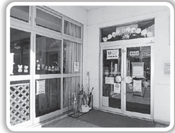
中野児童センター

補正予算では、新型コロナウイルスの対策経費として、大井児童センターと中野児童センターに25万円ずつ計上し、空気清浄機を遊戯室と事務室の2か所に設置するほか、マスクやパーテーションなどを購入する予定です。