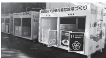
上矢作資源回収ステーション「ふくちゃん」

答 地域の活性化や持続可能な循環型社会の形成に繋がる事業で、「紙ごみ」も再資源化され、ごみ資源と資金と地域活動への流れが形成され、環境面に留まらない様々な相乗効果を生み出しており、更なる循環型社会の実現、形成に取組んでいきたいと考えている。(水道環境部長)