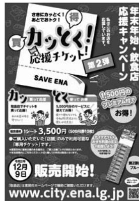
第2弾(カッたく! 応援チケット!)

新型コロナウイルス感染症の影響により、売上げの減少が見込まれる市内の飲食店を支援する「飲食店利用チケット補助事業」を拡充するため、既定の歳出予算の総額に8,000万円を計上する。