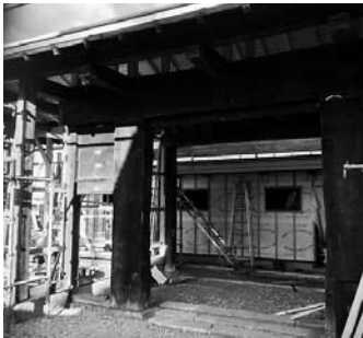
行在所へ移築工事中の長屋門