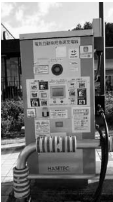
電気自動車急速充電設備

対象火気設備等の位置、構造及び管理並びに対象火気器具等の取扱いに関する条例の制定に関する基準を定める省令の一部改正に伴い、急速充電設備に係る基準を改めるなど、所要の改正を行う。