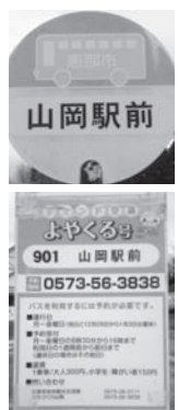
デマンド交通標示板