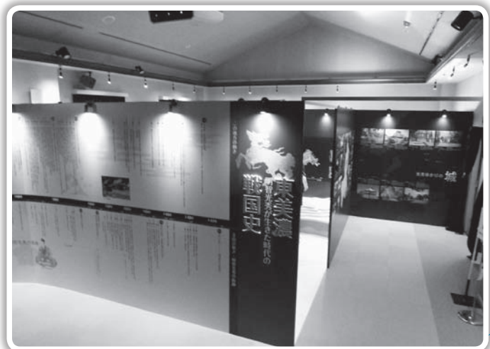
改装工事予定の大正ロマン館

工期については、約1ヶ月程度を予定していて、年度末には完成予定です。事業費は451万円計上されました。