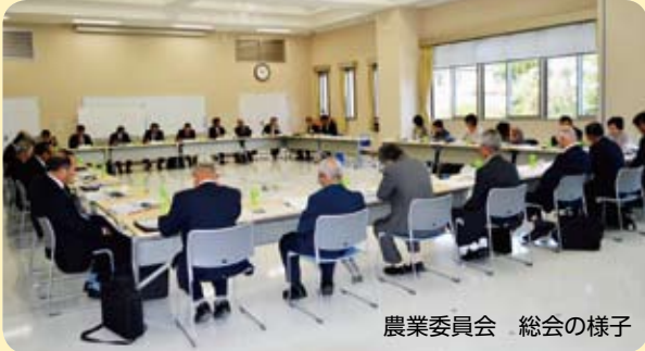
農業委員会 総会の様子