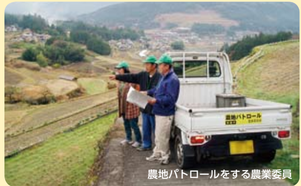
農地パトロールをする農業委員