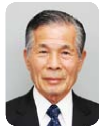
恵那市長 可知 義明