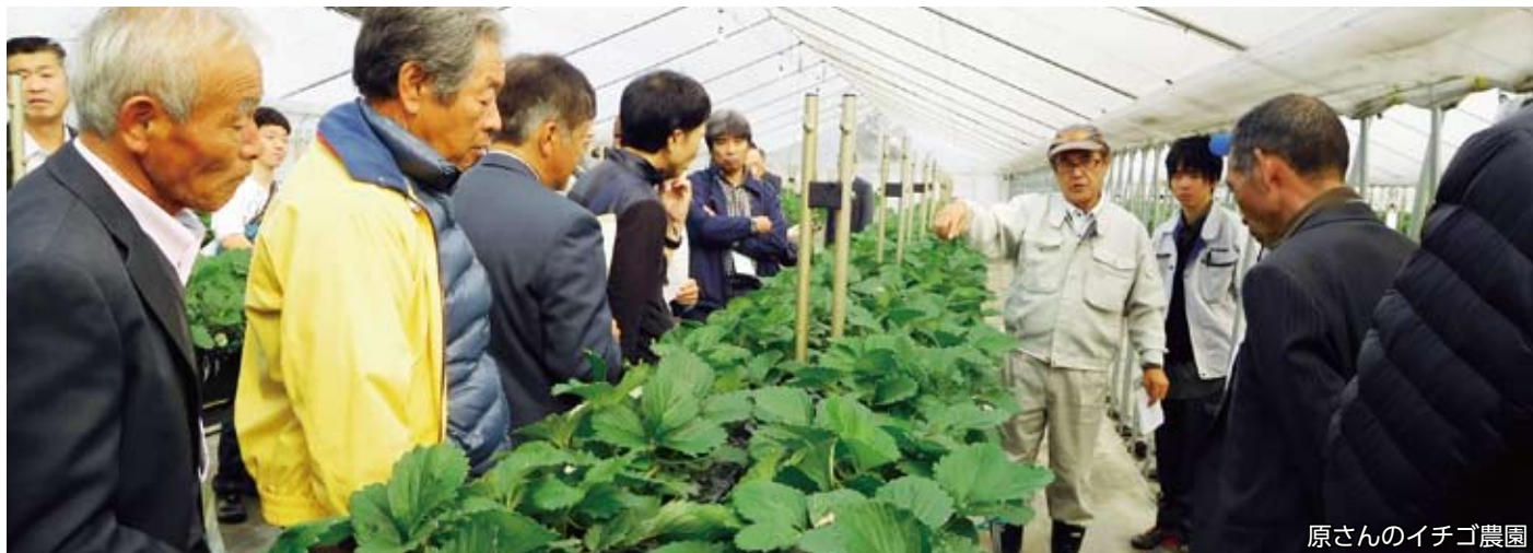
原さんのイチゴ農園