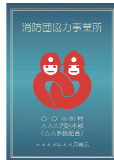
消防団協力事業所表示証

消防団協力事業所表示制度(総務省消防庁ホームページ) https://www.fdma.go.jp/relocation/syobodan/activity/company/