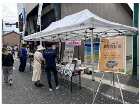
(イベント時乗り方教室)