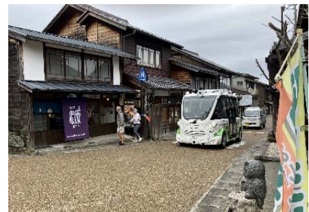
（自動運転バス実証実験）