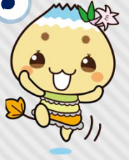
恵那市公式キャラクター「エーナ」

市内のバス運賃が令和5年3月に改正して、家計に優しいお得な運賃になったの知ってるかな??? 学生みんなにバスに乗って通学して欲しいんだナ♪