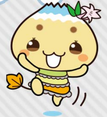
恵那市公式キャラクター「エーナ」

市内のバス運賃が令和5年3月に改正して、家計に優しいお得な運賃になったの知ってるかな?? 学生みんなにバスに乗って通学して欲しいんだナ♪