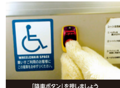
「降車ボタン」を押しましょう