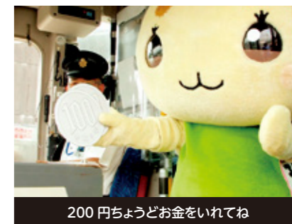
200円ちょうどお金をいれてね