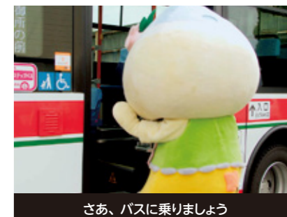
さあ、バスに乗りましょう