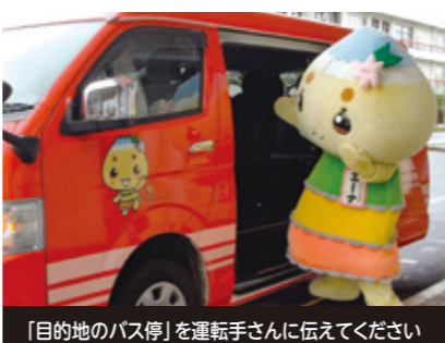
「目的地のバス停」を運転手さんに伝えてください