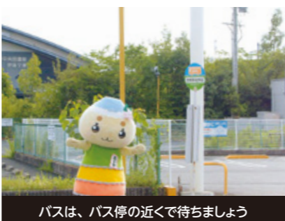
バスは、バス停の近くで待ちましょう