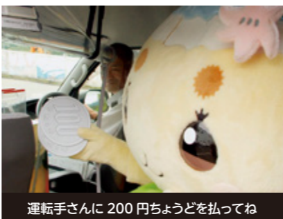
運転手さんに200円ちょうどを払ってね