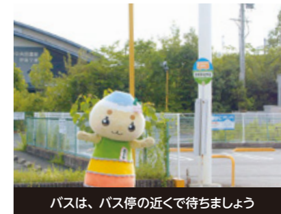
バスは、バス停の近くで待ちましょう