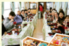
写真は寒天列車で味わえる弁当

地元の味が楽しめる、明知鉄道のグルメ列車。恵那駅から明智駅まで、四季折々の車窓の風景とともにきのこ料理や寒天料理、地酒などを楽しめます。ゆったり電車でお食事のあとは、大正村での散策をどうぞ。