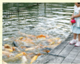
鯉の大群が押し寄せます

実は隠れた人気の池の鯉たち。週末には、受付で販売しているエサが100袋以上売れるのだとか。みっちり集まって口をパクパク開ける鯉たちの様子はなかなかの圧巻です。ぜひ一度体験してみては?