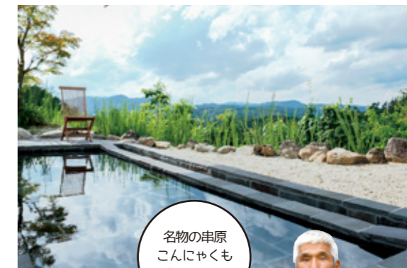
名物の串原こんにやくもご賞味ください

細い山道をうねうねと登った先にある温泉。露天風呂からの絶景と「美人の湯」が自慢です。周囲には各種レジャー施設やウォーキングコースがあり、1日中楽しめます。