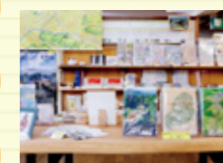
岩村らしいお土産が並ぶ町並みふれあいの館