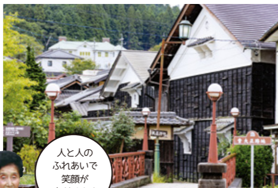
人と人のふれあいで笑顔が広がります

大正時代に製糸産業で栄えた明智には当時の建物が数多く残り、さながらまち丸ごとが博物館。町並みや生活文化、人情のあたたかさも、古き良き大正の薫りを伝えています。