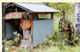
地域の人たちに守られる糸車と地蔵

大正浪漫亭裏の川端にある「糸曳き乙女地蔵」は、身投げした製糸女工を悼んで祀られたといわれています。実はこのお地蔵様、受験にご利益があると密かに人気なのです。その由来は…ぜひまちの人に聞いてみて。