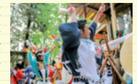
岐阜県重要無形民俗文化財

毎年10月、串原の総氏神である中山神社の大祭が行われます。そこで奉納されるのが、7つの太鼓を打ち鳴らす勇壮な中山太鼓。ささゆりの湯の駐車場では、中山太鼓のイベントがあることも。ぜひチェックしてみてください。