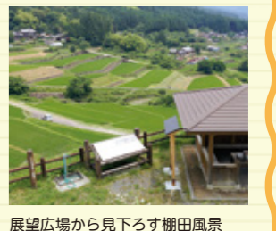
展望広場から見下ろす棚田風景

実施時期： 通年 実施時間： 10:00~12:00 13:00~15:00 所要時間： 約30分(約0.9km) 参加費用： 1,500円/名