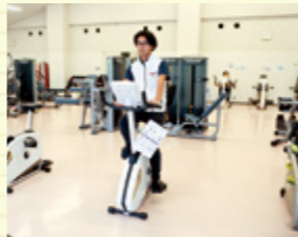
充実したトレーニングマシン

公園内のトレーニング室では、格安で各種マシンを利用することが可能。初回講習で使い方をしっかり学んで、ダイエットや筋力アップなど、自分の目的・目標に合わせたトレーニングに励みましょう!