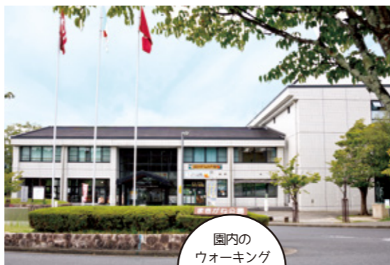
園内のウォーキングコースもおすすめです

恵那駅からバスで約10分のまきがね公園は、誰でも利用できる各種スポーツ施設や、遊具、ウォーキングコースも充実。自然の中で、のびのびと体を動かしてみませんか?