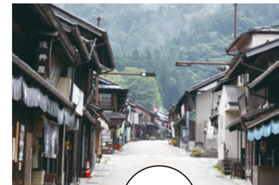
時間を気にせず ゆっくり 岩村散策を

古く鎌倉時代から続く城下町、岩村。山上の城跡や江戸の面影残る町並み、多彩なイベント、農村景観日本一の富田の風景など、いつ訪れても楽しめる魅力がいっぱいです。