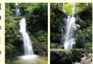
幸呼の滝 お軽の滝

串原にはそれぞれ名前のついた美しい「七つの滝」があります。ささゆりの湯を起点とする約4kmのウォーキングコースでは、そのうち「お軽の滝」「幸呼の滝」の2つを見ることができます。