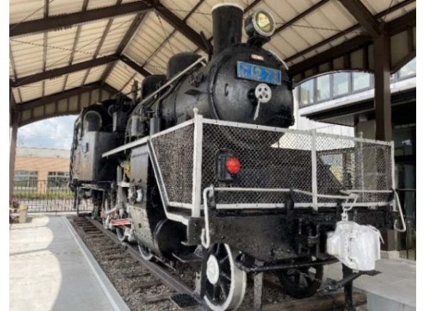
(恵那中央図書館で静態保存している C12 74)