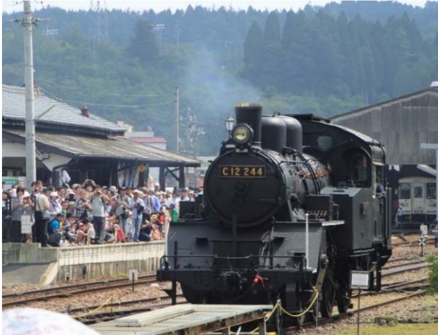
(明智駅構内でコンプレッサ簡易復元している C12 244)