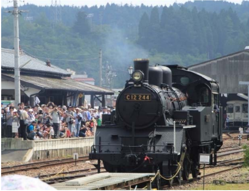
(明智駅構内でコンプレッサ簡易復元している C12 244)