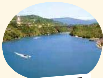
恵那峡県立自然公園