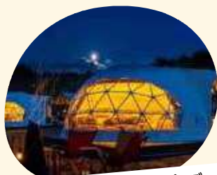
標高900m 保古グランピング