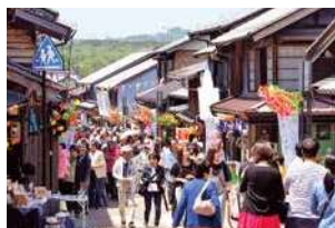
連続テレビ小説「半分、青い。」の舞台

複数企業からの寄附を活用し、映像の力で地域の魅力を全国へ発信。観光誘客と企業認知度の向上につながりました。現在も多くの映画やドラマのロケ地として活用されています。