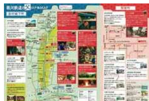
銀河鉄道の父 ロケ地MAP