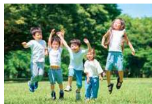
恵那の未来を担う子どもたち

不妊治療支援や出産応援金など子育て世代を支える施策や、よりそう支援・環境整備に活用し、切れ目のない子育て支援を通じて「子育てするなら恵那」と選ばれるまちづくりを進めています。