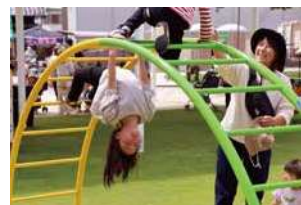
笑顔いっぱいの中央公園