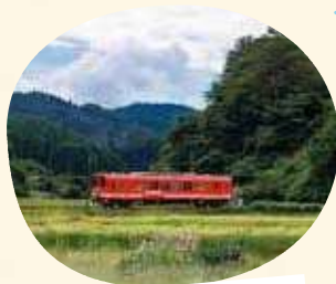
ローカル線 明知鉄道