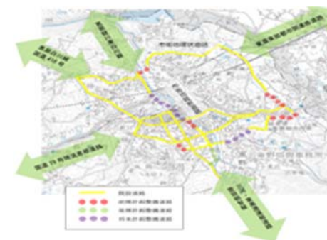
リニアまちづくり基盤整備計画