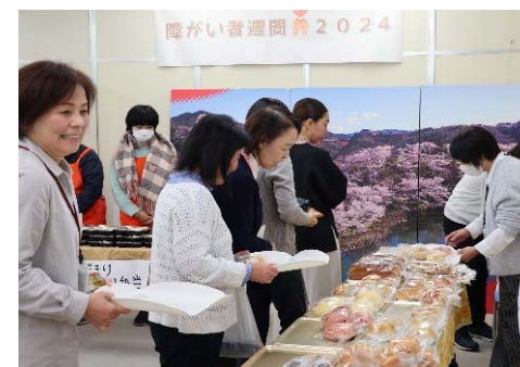
「障がい者週間」の様子