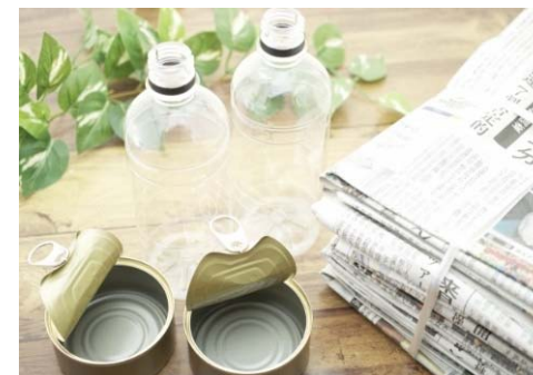
資源ごみのイメージ