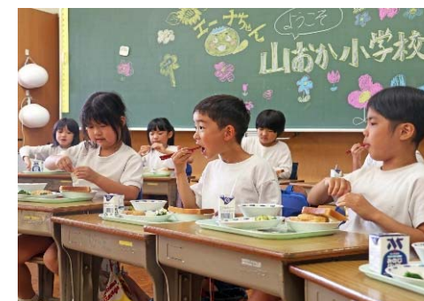
小学校での給食の様子