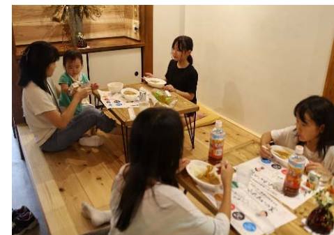
こども食堂の様子