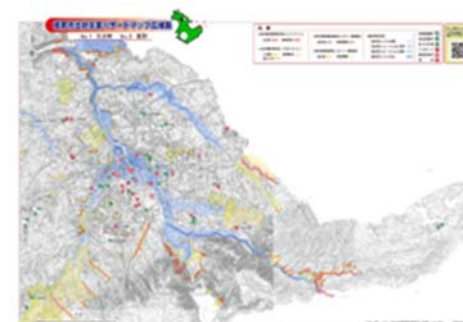
ハザードマップのイメージ