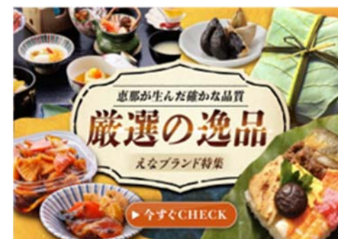
ふるさと納税PRバナー