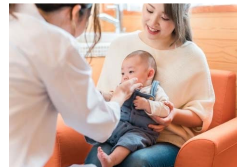
乳幼児健診（イメージ）