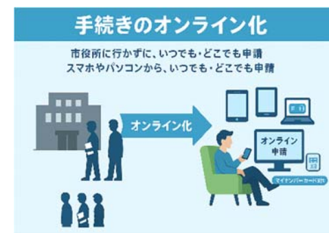
手続きのオンライン化（イメージ）