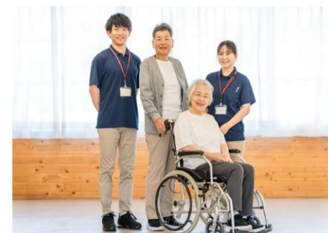
介護人材のイメージ