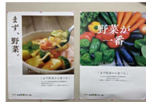
「えな野菜ファースト」啓発ポスター