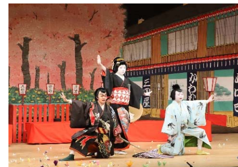
恵那市伝統芸能大会の様子