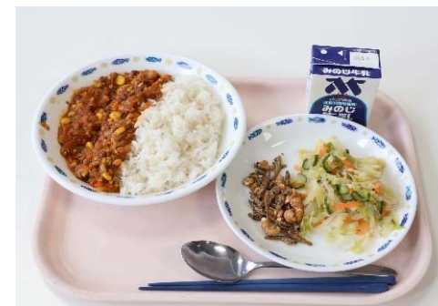
市内農産物を使った給食