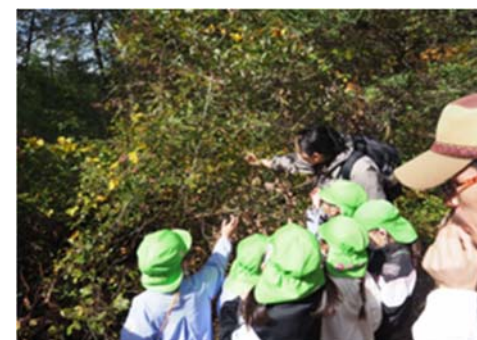
森林環境教育の様子