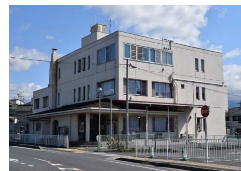
恵那福祉センター