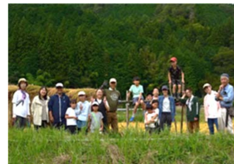
移住希望者向けの農業体験