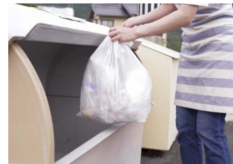
ごみ出しのイメージ