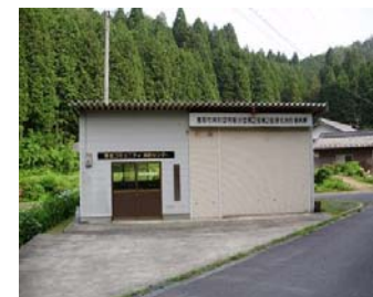
【図3】現在の野志消防器具庫