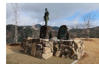
【図1】恵那峡再整備事業