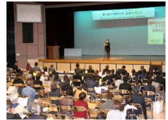
【図1】下田歌子賞記念イベント