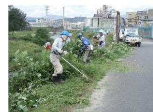
【図3】シルバー人材センター草刈り作業