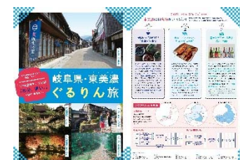
【図2】「半分、青い。」プロモーション事業

（注）主な事業を抜粋しているため、「基本施策の額」と「主な事業の合計額」が一致しない場合があります。