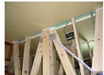
【図2】木造住宅耐震補強工事