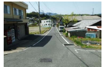
【図2】 おさしま二葉こども園関連道路整備事業箇所（こども園前）