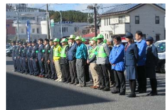
【図1】年末年始地域安全・交通安全出発式