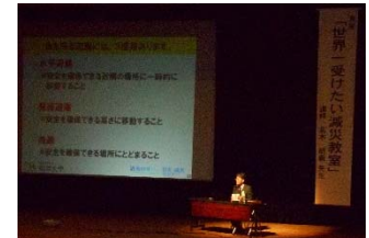
【図2】子育て親育ちフォーラム