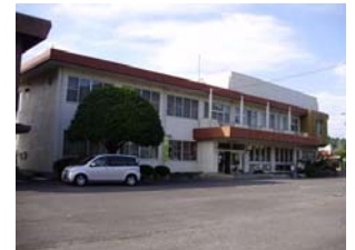
【図3】東野コミュニティセンター