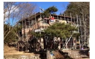
【図2】飯地高原自然テント村の整備