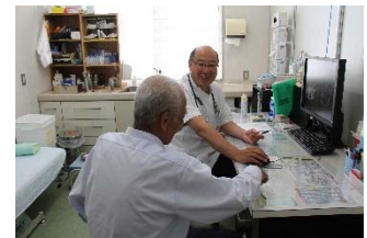
【図2】国保上矢作病院運営事業