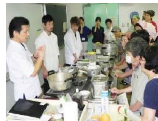
【図1】プロの料理人による健幸料理教室