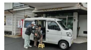
【図3】上矢作日常生活支援