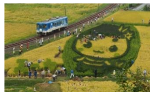
【図1】山岡たんぼdeアート！