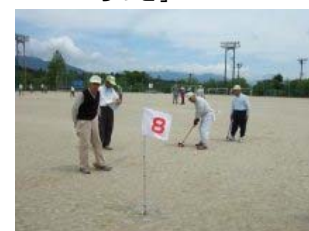
【図2】壮健クラブ軽スポーツ大会