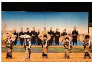
【図1】三郷歌舞伎保存会公演