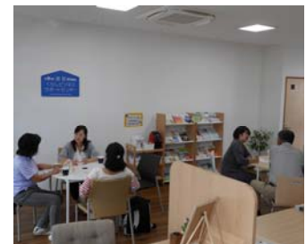
【図2】ビジネスサポートセンター内での相談