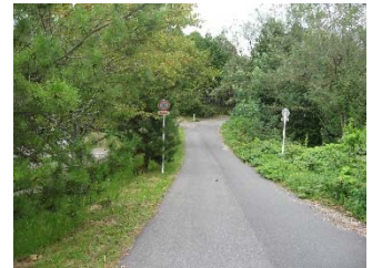
【図1】 恵那西工業団地進入路整備事業箇所（恵那西中学校南側）