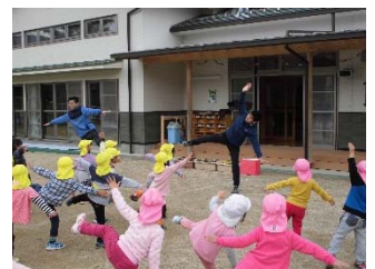
【図1】こども園運動プログラム