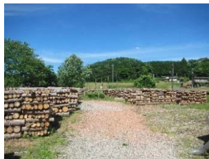
【図2】林地残材搬出事業