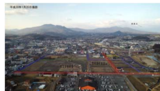
【図1】正家第二土地区画整理事業地