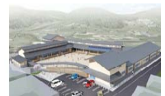
【図3】おさしま二葉こども園完成イメージ