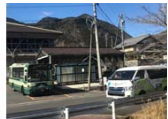
【図1】 いいじ里山バス