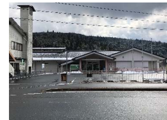
【図3】中野方コミュニティセンター