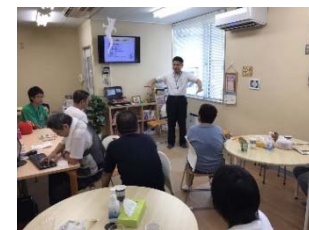
【図1】地域生活支援拠点「ぷらっと」