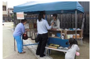
【図2】女性の起業に向けた出店体験