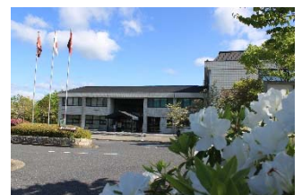
【図3】まきがね公園体育館

（注）主な事業を抜粋しているため、「基本施策の額」と「主な事業の合計額」が一致しない場合があります。