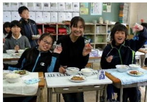
【図1】学校給食での地産地消推進