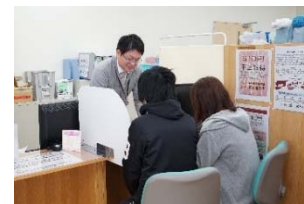
【図1】休日窓口開庁の様子

（注）主な事業を抜粋しているため、「基本施策の額」と「主な事業の合計額」が一致しない場合があります。