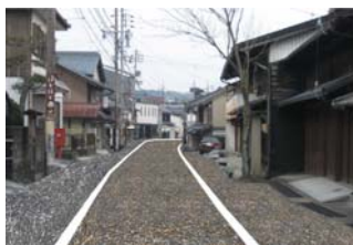
【図3】中山道宿場町大井地区景観舗装完成イメージ

(注) 主な事業を抜粋しているため、「基本施策の額」と「主な事業の合計額」が一致しない場合があります。