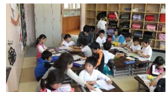
【図2】放課後児童クラブ