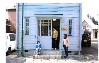
【図2】サテライトオフィス SOZO