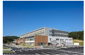
【図1】市立恵那病院運営事業