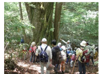
【図1】えなの森林魅力発信モデル事業イメージ

（注）主な事業を抜粋しているため、「基本施策の額」と「主な事業の合計額」が一致しない場合があります。