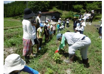
【図1】花咲か里山プロジェクト