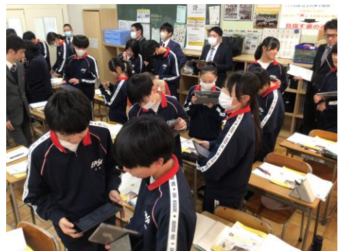
▲英語の授業でのペア交流の様子

学校においても、子ども一人一人の良さを大切に見つめ、安心して自分を信じられる環境づくりに努めてまいります。今後とも、本校の教育活動へのご理解とご協力をよろしくお願い申し上げます。