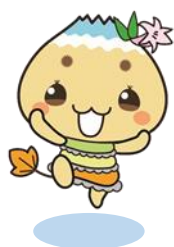
恵那市公式キャラクター エーナ

このハンドブックが、少しでも自治会役員の皆様のお役に立ち、自治会運営の一助になれば幸いです。