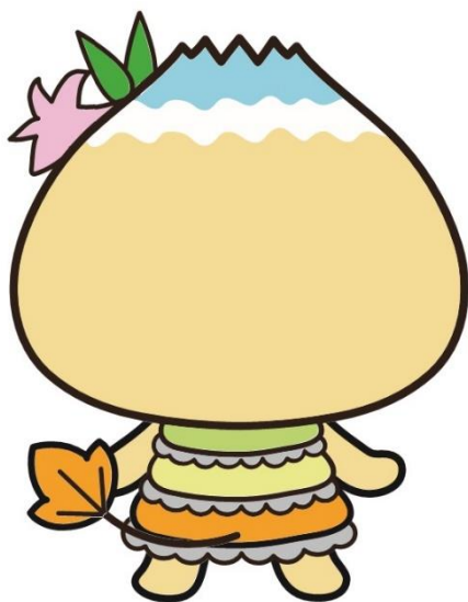
恵那市公式キャラクター エーナ