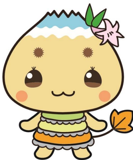
恵那市公式キャラクター エーナ