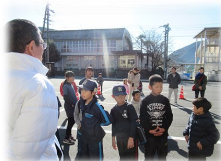
青少年育成会議会長のあいさつ

餅つき等の昔ながらの行事を通して、日本の伝統が伝えられていくと良いと思います。ご協力いただいた、スポーツ少年団保護者会、青少年育成推進員の皆さん、ありがとうございました。