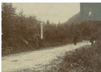
金原翁記念林(ふるさと東野より)

下の写真は、大正6年11月に撮影されたものです。昭和30年東野開発振興会が村政と山林の維持管理を、さらに昭和47年には東野生産森林組合に山林の維持管理を引き継がれ現在に至っています。