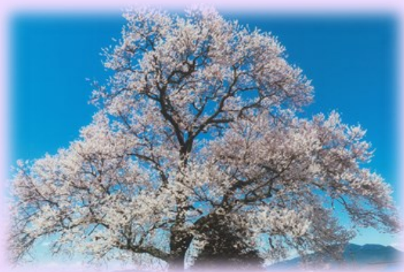
このサクラは松浦のサクラです