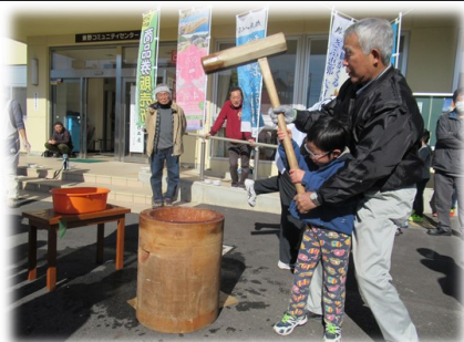
大人に助けられ、ペタンペタン

また、スポーツ少年団の保護者会の皆さんが作っていた豚汁をおかわりする子どもが続出し、おいしくいただきました。