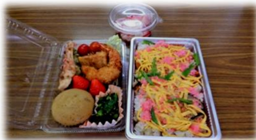
春色ちらし寿司他