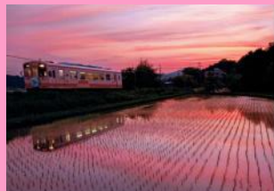
夕焼の田を走る 吉村 緑(中津川市)