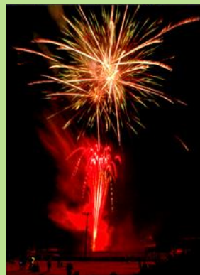
祭りのフィナーレ 吉村 清(中津川市)