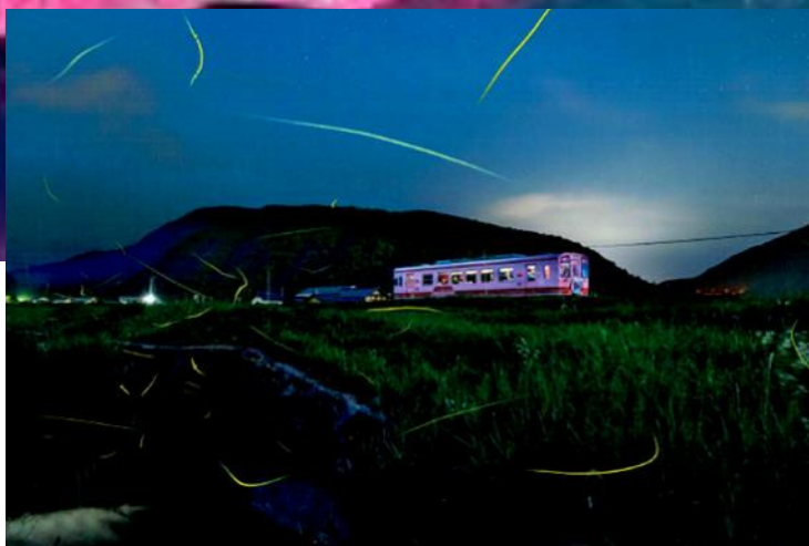
最優秀賞 ホタル舞う東野 安藤秀美(串原)