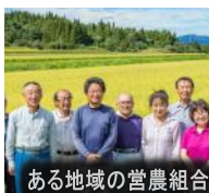
ある地域の営農組合