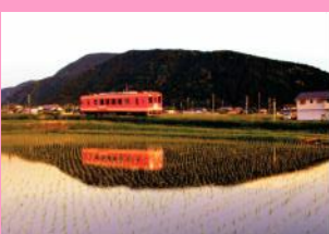
薄昏に映える電車 丸山年道(東野)