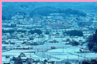
雪原を行く 吉村 清(中津川市)